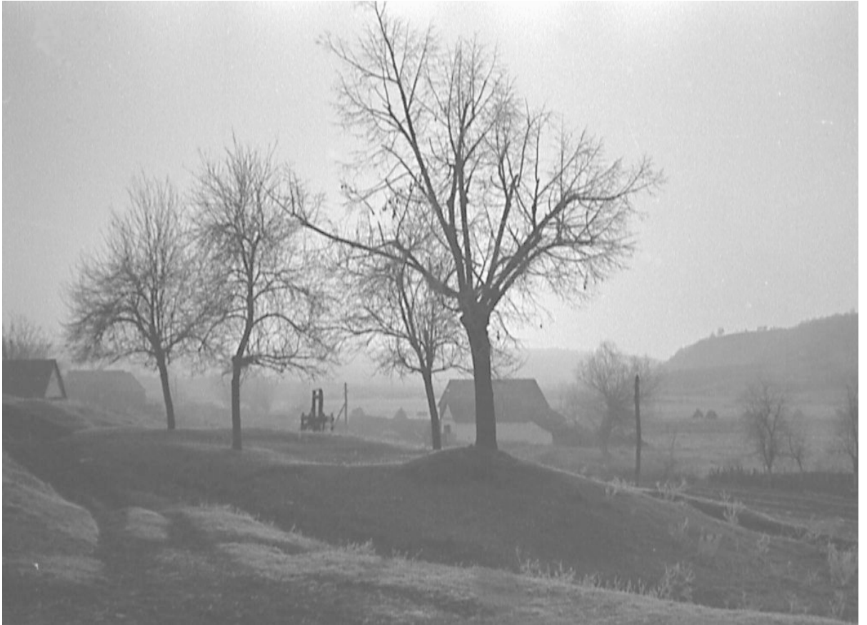
Pogled od moje rodne kuće kroz jutarnju sumaglicu