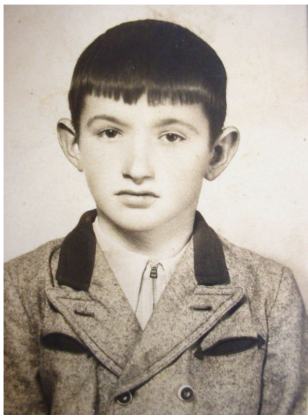
Moje slike iz vremena završetka osnovne škole i početka gimnazije u Slavonskom Brodu