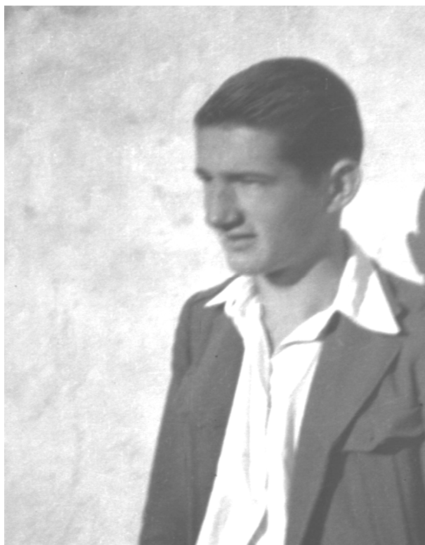
Poslije rata se nije imalo baš što obući, pa je dobro došla i vojna bluza