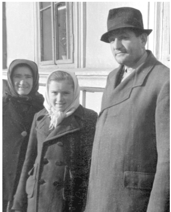
Tata, mama i seka Franjka u Brodu , ispred sobe u kojoj je stanovao tata za vrijeme službovanja u šumariji