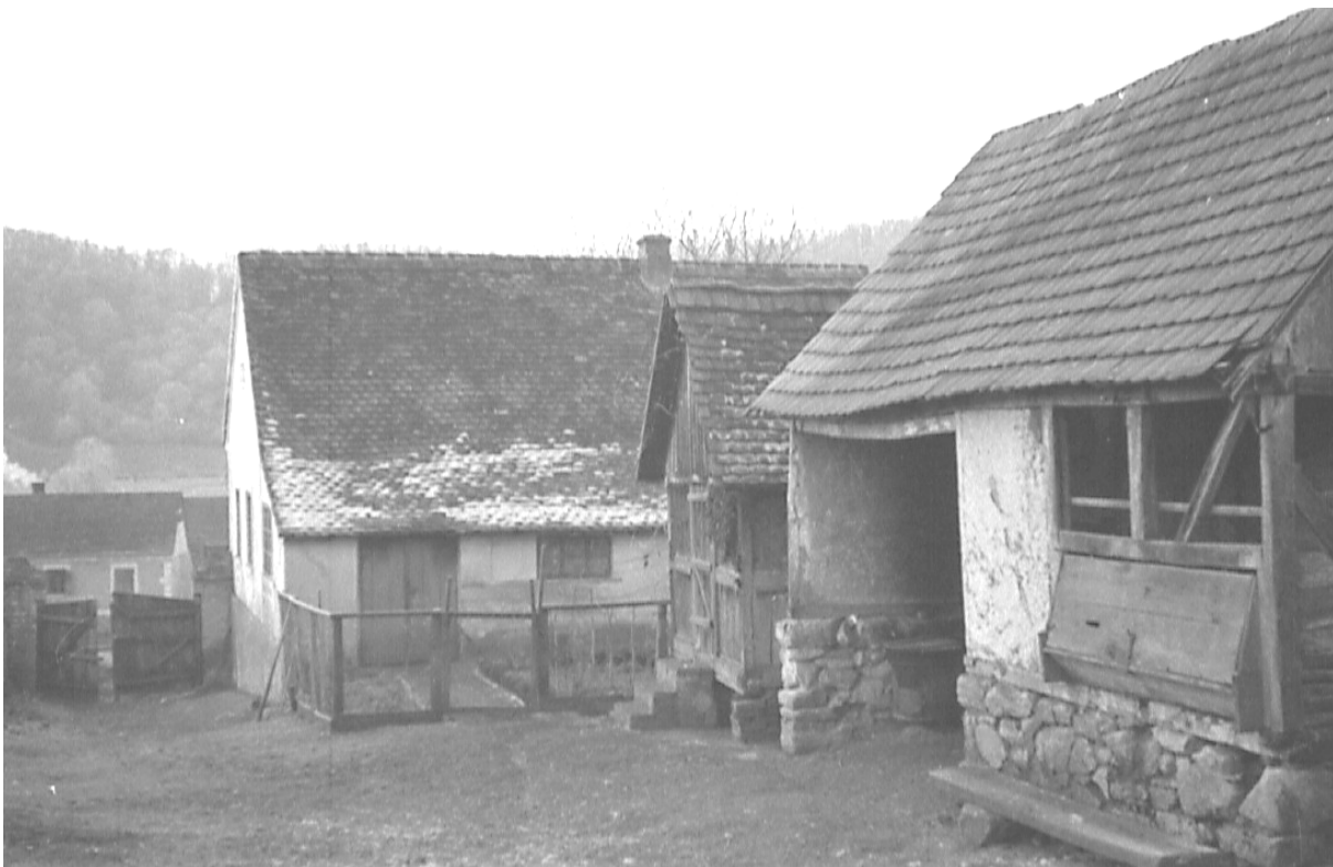
Dvorište moje rodne kuće

Ispred kuće (u dvorištu) vidi se «ambar», ispred njega zgrada sa šupom i svinjcem, a iza njega zahod. Dalje, u istom pravcu, veliki štagalj sa stajom za dvije krave i dva konja. S lijeve strane, (koja se ne vidi), bila je krušna peć, bunar i «verkštet». U verkštetu smo imali «araniju», veliki kazan za kuhanje «cokava», tako se u nas zvale bundeve, kojima smo hranili marvu. Iza verkšteta je bio «drvnik», gdje smo rezali i cijepali drva za loženje «šporeta» u kuhinji i peći u sobi, te cokava za stoku.